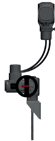
Unterflur-Antrieb Typ EM